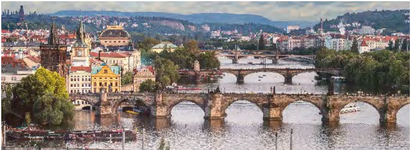
Prague, Photo by JESHOOOTS from Pexels

Apžvalga su muitinės sritimi susijusių teisės aktų ir pranešimų, paskelbtų ES oficialiajame leidinyje, taip pat informacijos, kurią skelbia Europos Komisija, Pasaulio muitinių organizacija ir Pasaulio prekybos organizacija. Atnaujinama kas savaitę!